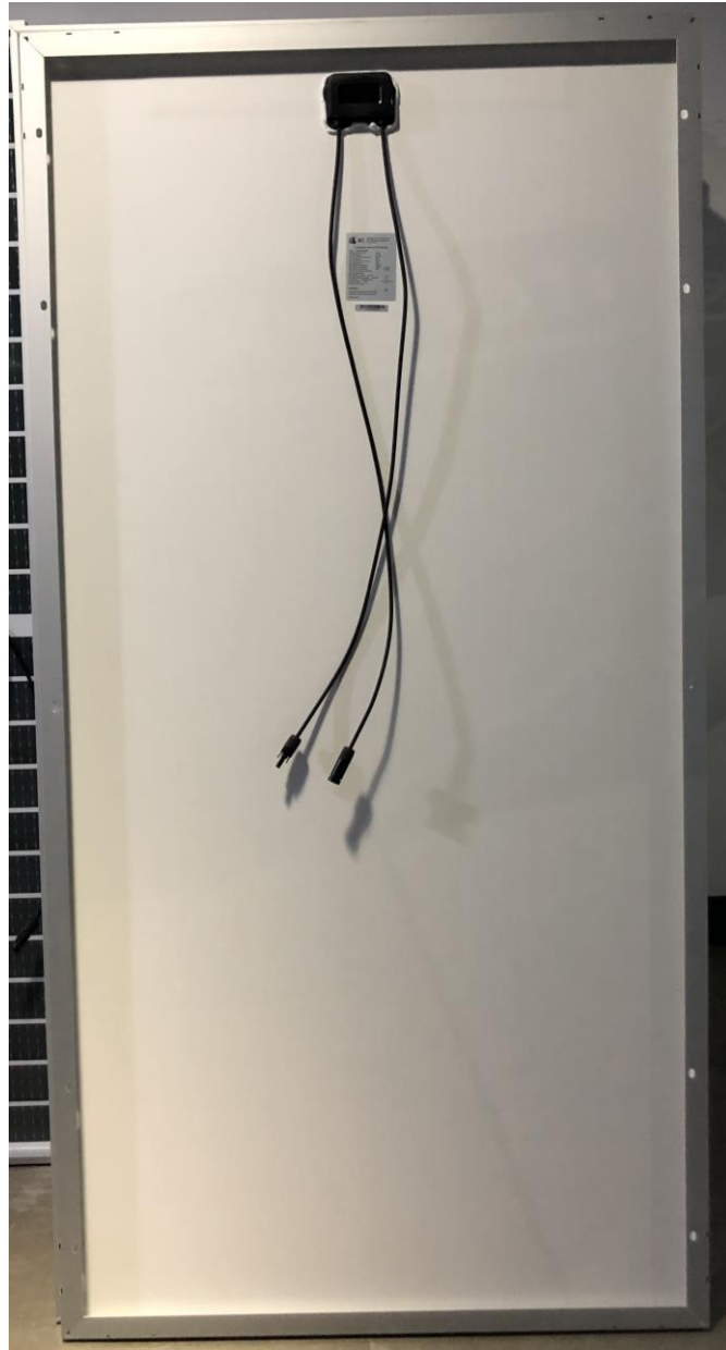
Photo 2: Rear view of module type SP72S-335WE Foto 2: Vista da parte traseira do tipo de módulo SP72S-335WE