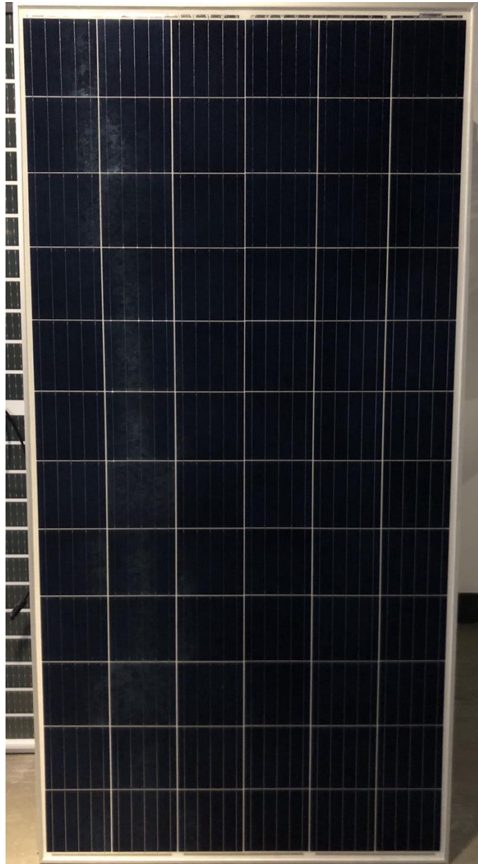
Photo 1: Front view of module type SP72S-335WE Foto 1: Vista frontal do tipo de módulo SP72S-335WE